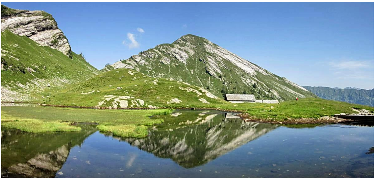
Il Pizzo Roggia dal laghetto di Moino, con la cresta di salita (sinistra)