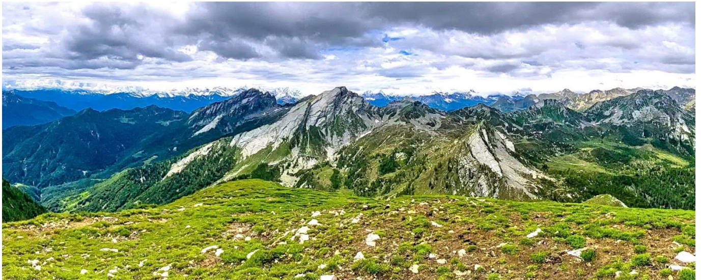
Panorama dalla vetta del Pizzo Roggia