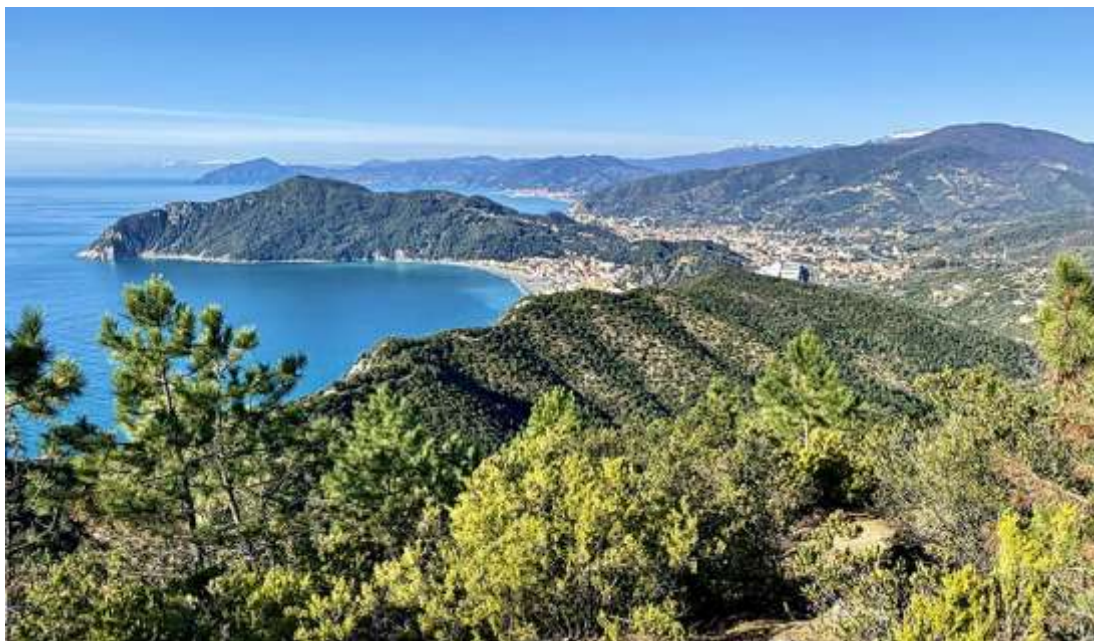
Panorama dal Monte Moneglia verso Punta Manara e il promontorio di Portofino